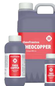
Διατίθεται στις συσκευασίες των 0,2,0,5, 1, 3, 5 και 20 λίτρων.

• Ψεκάσμος με 300-500cc σε 100Kg νερό ανά στρέμμα. Ριζοπότισμα με 1-2 L ανά στρέμμα.