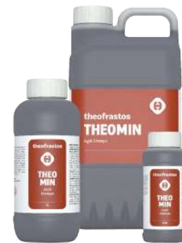
Διατίθεται στις συσκευασίες των 0,2,0,5, 1 και 5 λίτρων.

• Ψεκάσμος με 100-200cc σε 100Kg νερό ανά στρέμμα. Ριζοπότισμα με 1-1,5 L ανά στρέμμα.