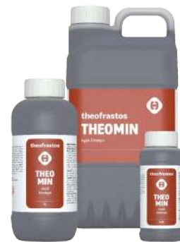
Διατίθεται στις συσκευασίες των 0,2,0,5, 1 και 5 λίτρων.

• Ψεκασμός με 100-200cc σε 100Kg νερό ανά στρέμμα. Ριζοπότισμα με 1-1,5 L ανά στρέμμα.