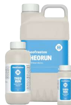
Διατίθεται στις συσκευασίες των 0,2, 0,5, 1, 3, 5 και 20 λίτρων.

• Ψεκασμός με 300-500cc σε 100 Kg νερό ανά στρέμμα. Ριζοπότισμα με 1-2 L ανά στρέμμα.