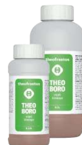
Διατίθεται στις συσκευασίες των 0,25 και 0,5 λίτρου.

• Ψεκασμός: Μαρούλι / Σαλάτες 20-30 cc σε 100Kg νερό ανά στρέμμα. Μηλιά, Αχλαδιά, Μανταρινιά, Κολοκυνθοειδή 50 cc σε 100Kg νερό ανά στρέμμα. Ελιά, Αμπέλι, Ντομάτα, Πιπεριά, Μελιτζάνα 100 cc σε 100Kg νερό ανά στρέμμα. Ριζοπότισμα: 150-500 ml ανά στρέμμα.