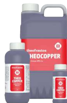
Διατίθεται στις συσκευασίες των 0,2,0,5, 1, 3, 5 και 20 λίτρων.

• Ψεκασμός με 300-500cc σε 100Kg νερό ανά στρέμμα. Ριζοπότισμα με 1-2 L ανά στρέμμα.