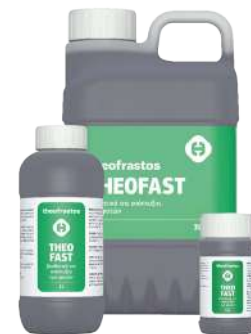
Διατίθεται στις συσκευασίες των 0,2, 1 και 3 λίτρων.

• Ψεκασμός με 200cc σε 100Kg νερό ανά στρέμμα και ριζοπότισμα με 1 L/στρέμμα.