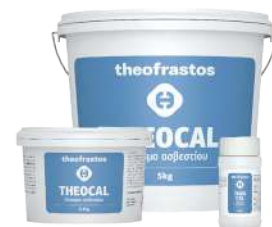
Διατίθεται στις συσκευασίες των 0,2, 0,5, 1 και 5 Kg .

• Ψεκασμός: Μαρούλι / Σαλάτες 20-30 gr σε 100Kg νερό ανά στρέμμα. Μηλιά, Αχλαδιά, Μανταρινιά, Κολοκυνθοειδή 50 gr σε 100Kg νερό ανά στρέμμα. Ελιά, Αμπέλι, Ντομάτα, Πιπεριά, Μελιτζάνα 100 gr σε 100Kg νερό ανά στρέμμα. Ριζοπότισμα με 0,5-1 Kg ανά στρέμμα.