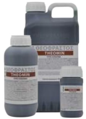
Διατίθεται στις συσκευασίες των 0,2,0,5, 1 και 5 λίτρων.

• Ψεκασμός με 100-200cc σε 100Kg νερό ανά στρέμμα. Ριζοπότισμα με 1-1,5 L ανά στρέμμα.