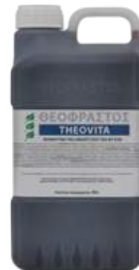
Διατίθεται σε συσκευασία 5 λίτρων.

ΒΑΣΙΚΕΣ ΛΕΙΤΟΥΡΓΙΕΣ ΚΑΙ ΙΔΙΟΤΗΤΕΣ: Το υγρό οργανικό λίπασμα THEOVITA είναι ένα ενισχυτικό συμπλήρωμα για το δυνάμωμα και αύξηση των φυτών. Εμπλουτίζει το έδαφος και εφοδιάζει τα φυτά με οργανική ουσία για μεγάλο χρονικό διάστημα. Έχει παρατηρηθεί ότι παρέχει στα φυτά αυξημένες ιδιότητες απορρόφησης των θρεπτικών στοιχείων (μακρο-μικροστοιχεία) από το έδαφος και καλύτερη αφομοίωσή τους από το φυτό. Το THEOVITA ενισχύει το ριζικό σύστημα των φυτών και την εναλλακτική τους ικανότητα και δίνει τη δυνατότητα στο φυτό να παράγει αιθυλένιο. Έχει παρατηρηθεί ότι ριζοπότισμα των καλλιεργειών από την αρχή του ποτίσματος με 1-2 L ανά στρέμμα THEOVITA , δίνει πρωιμότητα 7-10 ημέρες . Τα μικρά φυτά αναπτύσσονται ενώ τα μεγάλα παράγουν σάκχαρα και καλύτερο χρώμα στους καρπούς (οι μικροί καρποί διογκώνονται πρώτα, αυξάνεται το ποσοστό των σακχάρων τους και έπειτα καλύτερεύει το χρώμα τους).