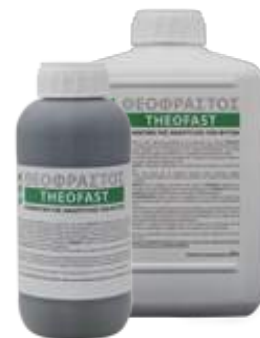
Διατίθεται στις συσκευασίες των 1 και 2 λίτρων.

• Ψεκασμός με 200cc σε 100Kg νερό ανά στρέμμα και ριζοπότισμα με 1 L/στρέμμα.