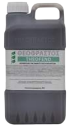
Διατίθεται στη συσκευασία 5 λίτρων.