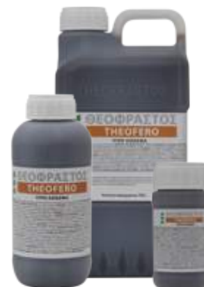
Διατίθεται στις συσκευασίες των 0.2, 0.5, 1 και 5 λίτρων.

• Ψεκασμός με 300-500cc σε 100Kg νερό ανά στρέμμα. Ριζοπότισμα με 0,5-1 L ανά στρέμμα.