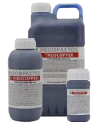
Διατίθεται στις συσκευασίες των 0,2,0,5, 1, 3 και 5 λίτρων.

• Ψεκασμός με 300-500cc σε 100Kg νερό ανά στρέμμα. Ριζοπότισμα με 1-2 L ανά στρέμμα.