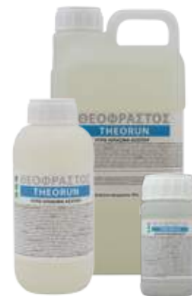
Διατίθεται στις συσκευασίες των 0.2, 0.5, 1, 3 και 5 λίτρων.

• Ψεκασμός με 300-500cc σε 100 Kg νερό ανά στρέμμα. Ριζοπότισμα με 1-2 L ανά στρέμμα.