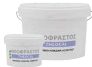
Διατίθεται στις συσκευασίες των 500 gr και 5 Kg .

• Ψεκασμός: Μαρούλι / Σαλάτες 20-30 gr σε 100Kg νερό ανά στρέμμα. Μηλιά, Αχλαδιά, Μανταρινιά, Κολοκυνθοειδή 50 gr σε 100Kg νερό ανά στρέμμα. Ελιά, Αμπέλι, Ντομάτα, Πιπεριά, Μελιτζάνα 100 gr σε 100Kg νερό ανά στρέμμα. Ριζοπότισμα με 0,5-1 Kg ανά στρέμμα.