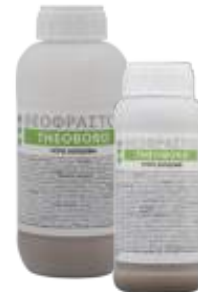
Διατίθεται στις συσκευασίες των 0.25 και 0.5 λίτρου.

• Ψεκασμός: Μαρούλι / Σαλάτες 20-30 cc σε 100Kg νερό ανά στρέμμα. Μηλιά, Αχλαδιά, Μανταρινιά, Κολοκυνθοειδή 50 cc σε 100Kg νερό ανά στρέμμα. Ελιά, Αμπέλι, Ντομάτα, Πιπεριά, Μελιτζάνα 100 cc σε 100Kg νερό ανά στρέμμα. Ριζοπότισμα: 150-500 ml ανά στρέμμα.