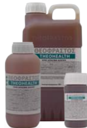
Διατίθεται στις συσκευασίες των 0.2, 0.5, 1, 3 και 5 λίτρων.

• Ψεκασμός: Συστήνεται ψεκασμός το πρωί με 500cc έως 1 L σε 100 Kg νερό ανά στρέμμα.