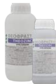
Διατίθεται στις συσκευασίες των 0.5 και 1 λίτρων.

• Ψεκασμός με 100-150cc σε 100Kg νερό ανά στρέμμα. Ριζοπότισμα με 0,5-1 L ανά στρέμμα.