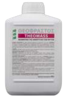
Διατίθεται στη συσκευασία 2 λίτρων.