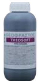
Διατίθεται στη συσκευασία του 1 λίτρου.

• Ψεκασμός με 100-200cc σε 100Kg νερό ανά στρέμμα και ριζοπότισμα με 1,5-2 L/στρέμμα.