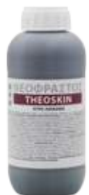
Διατίθεται στη συσκευασία του 1 λίτρου.

• Ψεκασμός με 100-200cc σε 100Kg νερό ανά στρέμμα και ριζοπότισμα με 1-1,5 L/στρέμμα.